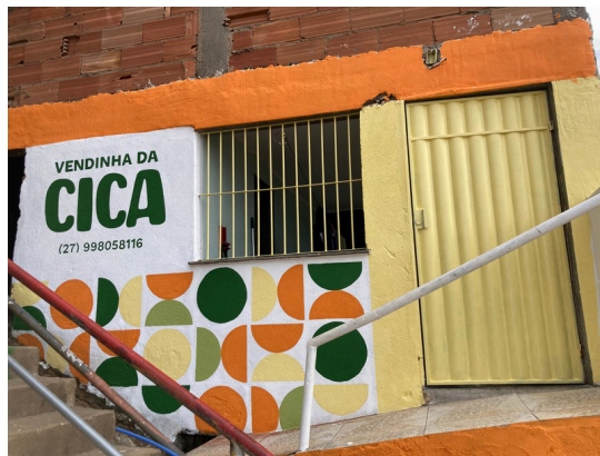
Vendinha da Cica