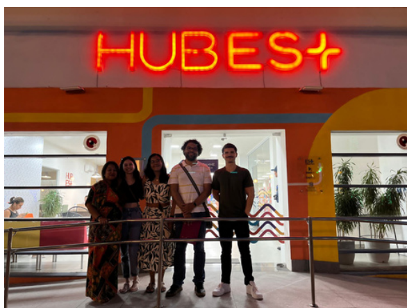
Equipe da Ufes no Hub ES+