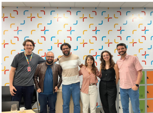
Equipe gestora do projeto - Ufes, Ifes, Secult, CEET Vasco Coutinho