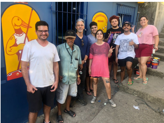
Estudantes e coordenação do Design em Parceria durante a execução do projeto no Bar Santo Antônio Baiano