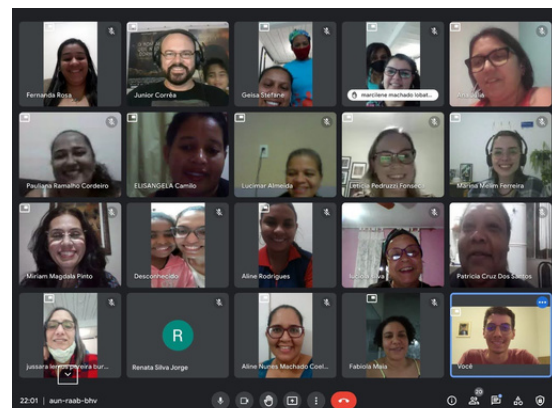
Registro de curso online