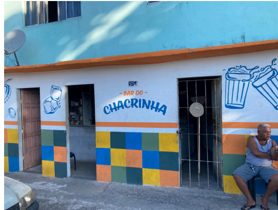
Bar do Chacrinha