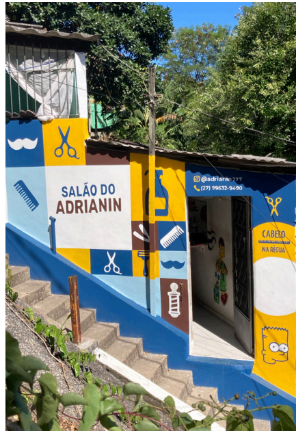
Salão do Adrianin