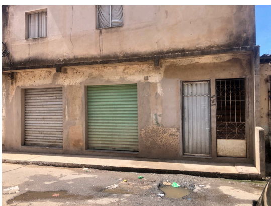
Distribuidora Du's Faixa