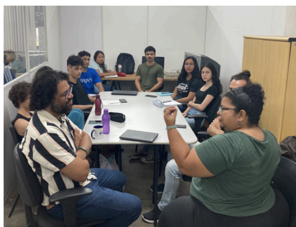
Encontro com profissionais da economia criativa para discutir a trilha gamificada do Hub ES+