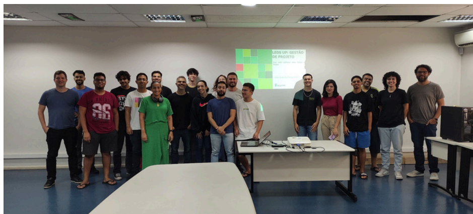
Equipe Ifes e Ufes reunida em maio de 2024

Iniciado no final de 2023, fruto de uma parceria entre o Laboratório de Práticas Extensionistas em Experiência do Usuário (LUX/Ufes) e o Laboratório de Extensão em Desenvolvimento de Soluções (LEDS/Ifes), o projeto “Conecta Fapes” tem como objetivo desenvolver a nova versão do sistema de gestão SigFapes, da Fundação de Amparo à Pesquisa e Inovação do Espírito Santo (Fapes). O SigFapes é responsável por receber submissões dos editais de pesquisa, bolsas, eventos acadêmicos e demais atividades de fomento à ciência e à inovação no Espírito Santo.