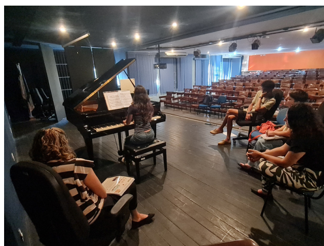
Registro de aula coletiva realizada em outubro.

O grupo também realiza concertos bimestrais para apresentar à comunidade o trabalho realizado durante os ensaios do projeto, levando obras do repertório pianístico para o público leigo e especializado em recitais.