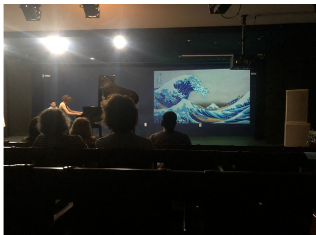
Recital “Prelúdios e Poéticas Pianísticas.”