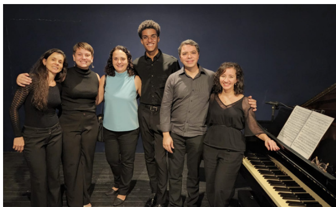
Recital realizado em outubro.